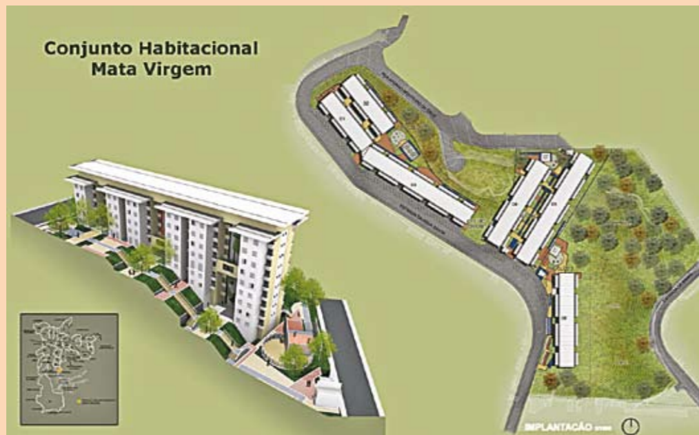
Projeto para a Mata Virgem: uso do terreno e das áreas verdes a favor do ambiente.

C omeça a construção de moradias da fase 2 do Programa Mananciais. São os apartamentos para as famílias retiradas das margens das represas Billings e Guarapiranga. O primeiro projeto é o conjunto habitacional Mata Virgem – que incorpora tecnologia ambiental. A arquitetura se adapta ao local, respeitando o contexto, preservando as áreas verdes e a topografia. Em vez de asfalto e concreto, por exemplo, haverá grama e piso drenante. São três condomínios, total de seis prédios com 407 apartamentos. O programa todo prevê a construção de 4.500 unidades ao longo dos próximos três anos.