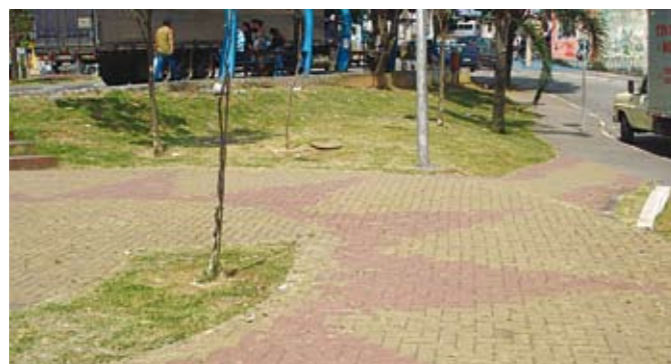
Praças sempre limpas: um dos objetivos do programa de Zeladoria.

Desde o início deste mês, a Subprefeitura instituiu o novo sistema de Zeladoria Preventiva, para minimizar e evitar problemas comuns no bairro. É uma equipe que verifica e previne os problemas de todos os dias: buracos nas vias, entulho, lixo e podas, capinação, varrição, carcaças de carros, praças. A Subprefeitura dividiu a região em 12 setores – os mesmos da operação Cata-Bagulho – que serão 100% vistoriadas. Os agentes também vão procurar conversar com os moradores para saber de problemas que, às vezes, não aparecem tão facilmente. Ao final de cada semana, a ideia é identificar necessidades e aumentar os serviços da Prefeitura nas ruas.