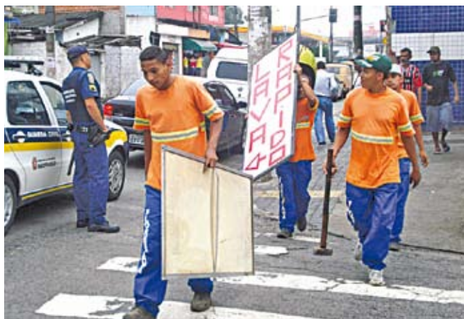
Apreensões: a lei Cidade Limpa regula os anúncios.

Para inibir o comércio de produtos ilegais, a Subprefeitura fez mais uma operação na feira do rolo (foto), na av. Cupecê, e apreendeu CDs e DVDs piratas, bebidas, alimentos, eletrônicos, cigarros e brinquedos. Essas ações são parte da operação de controle do espaço público e fiscalização de ambulantes, com apoio da Guarda Civil Metropolitana (GCM).