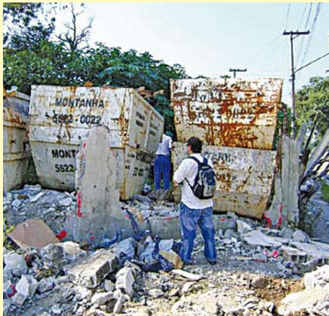
Caçambas fora do padrão: prejuízos ambientais

Operação conjunta da Subprefeitura, Secretaria Municipal do Verde e Meio Ambiente, Guarda Civil Metropolitana (GCM) e Polícia Militar (PM) interditou um depósito irregular de caçambas na estrada do Alvarenga, s/n°. Como parte da Operação Defesa das Águas, a Prefeitura constatou crimes ambientais e falta de licença. Além de ter o depósito lacrado, o dono do terreno será notificado e multado. A Operação é uma parceria da Prefeitura e do Governo do Estado para controlar, recuperar e urbanizar os mananciais. Aqui, trata-se da Represa Billings e seu entorno.