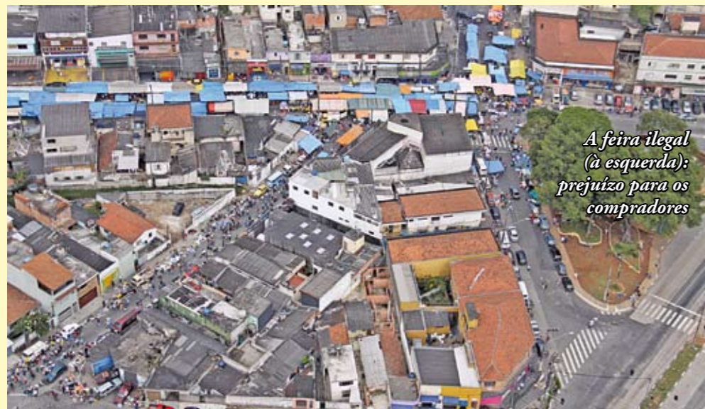
A feira ilegal (à esquerda): prejuízo para os compradores