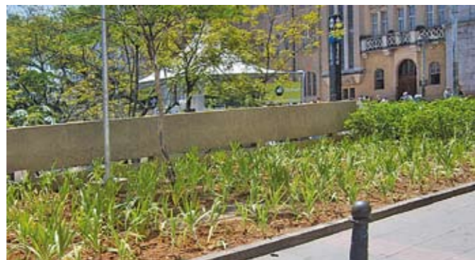
Canteiro repleto de novas mudas embelezam o local