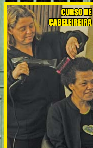
CURSO DE CABELEIREIRA

O Centro de Referência da Mulher 25 de Março mudou de nome. Agora, se chama Centro de Cidadania da Mulher (CCM) 25 de Março. É um lugar que atende vítimas de violência. Ali há profissionais que orientam as mulheres que querem denunciar um agressor, por exemplo, ou dar entrada em um pedido de separação. Há também psicólogas que dão apoio por meio de conversas e rodas de reflexão em grupo. Outro serviço prestado no CCM são os cursos, que ajudam as mulheres a se inserir na vida social ou mesmo no mercado profissional. Os cursos são de cabeleireira, manicure, idiomas, fotografia, maquiagem e dança, entre outros. Em toda a cidade existem seis CCMs. Neles, são registrados, por ano, cerca de 90 mil atendimentos. O CCM 25 de Março fica na rua 25 de Março, 205. O telefone é 3106-1100.