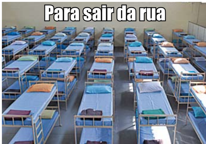
Centro de Acolhida Barra Funda II: 300 leitos, chuveiros e refeições

O Centro de Acolhida Barra Funda II já está funcionando. Fica na rua Boraceia, 270, em Santa Cecília. Lá, pessoas que vivem na rua podem passar a noite, tomar banho, jantar e tomar café da manhã. Há também uma equipe de profissionais que orienta como os usuários podem entrar nos programas de transferência de renda, de capacitação e, até, como tirar documentos. Tudo para ajudar quem não quer mais morar nas ruas. O novo Centro de Acolhida pode atender até 300 homens. Em toda a cidade há 45 desses centros, totalizando 8.600 leitos.