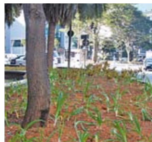
Praça Oswaldo Cruz: reformada

A cidade fica mais bonita quando as áreas verdes estão bem cuidadas. Pensando nisso, a Subprefeitura Sé vem reformando boa parte delas. É o caso dos canteiros da praça Oswaldo Cruz, do Pátio do Collegio e da praça João Mendes. Eles tiveram as muretas reformadas e o plantio de novas espécies. Os canteiros da avenida São Luiz e das ruas Santo Amaro, Santo Antônio e Japurá estão em obras. O trabalho é feito com os Zeladores de Praça da região, que ajudaram no plantio e vão fazer a conservação. O projeto Zeladores promove a melhoria das áreas verdes e ainda permite a inclusão social e qualificação profissional de desempregados com baixa escolaridade.