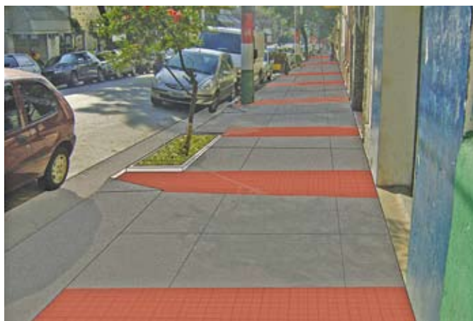
Fotomontagem da calçada pronta

é das 8h30 às 9h30. A Subprefeitura Sé fica rua Álvares Penteados, 53.