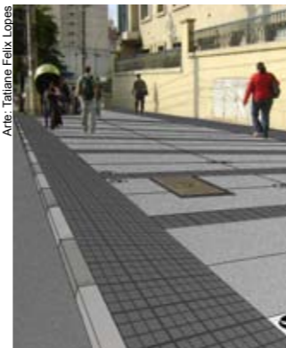
Ilustração da futura calçada

As calçadas da avenida Liberdade, entre as ruas Álvares Machado e Pedroso, vão ficar com a cara oriental do próprio bairro. O piso vai ser trocado por concreto moldado e ladrilho hidráulico com detalhes típicos japoneses. O novo piso vai privilegiar a facilidade de acesso para quem tem mobilidade reduzida: rampas e piso podotátil. A calçada terá também local específico para a colocação de árvores e postes de iluminação, de acordo com as normas do Programa Passeio Livre.