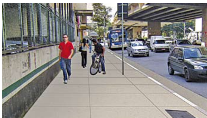
Ilustração mostra como ficará a calçada da Amaral Gurgel

O antigo prédio do Cine Marrocos vai ser a sede da Secretaria Municipal de Educação. A mudança deve acontecer no início de 2012 e faz parte do projeto de revitalização do Centro. O prédio foi construído na década de 1940 e é um importante símbolo arquitetônico da história da cidade. O hall de entrada do cinema é um espaço tombado e vai fazer parte da Praça das Artes, área que está sendo revitalizada, entre a avenida São João e as ruas Conselheiro Crispiniano e Formosa.