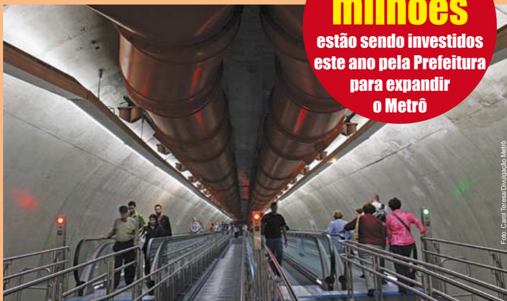
Estação Paulista: esteira rolante e fachada (no detalhe) da nova estação da Linha Amarela

Estão funcionando, experimentalmente, as estações Faria Lima e Paulista da Linha Amarela do Metrô. O trecho, de 3,6 km de extensão, é feito em 3 minutos e meio. O Metrô prevê que, neste primeiro trecho, vão circular, em média, 700 mil passageiros por dia. Quando toda a linha ficar pronta, da Vila Sônia à Luz, terá 12,8 km de extensão, 11 estações e integração com as linhas Verde, Vermelha e Azul e com a linha Esmeralda da CPTM. A conclusão da Linha Amarela está prevista para 2013. As próximas estações a operar serão Butantã e Pinheiros.