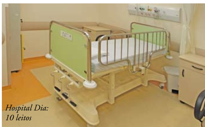
Hospital Dia: 10 leitos

O Centro é uma das 12 regiões da cidade que estão recebendo grelhas de plástico reciclado em substituição às de aço. O objetivo é evitar o furto das grelhas de metal que ficam nas sarjetas. As de plástico não têm valor comercial – como as de aço – e funcionam da mesma forma. Anualmente, a Prefeitura repõe cerca de 4 mil grelhas furtadas. Elas auxiliam no escoamento da água da chuva, impedindo que objetos caiam em galerias e ramais e causem entupimento do sistema de drenagem, o que provoca enchentes.