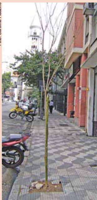
Ipê na rua Rego Freitas