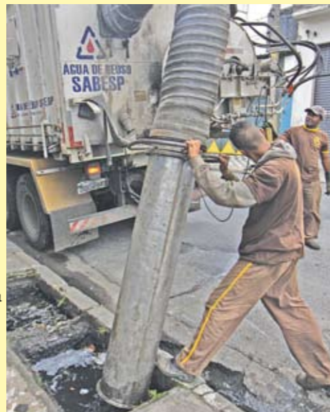
Limpeza mecanizada na rua São Paulo

Todos os dias, equipes da Subprefeitura estão nas ruas para limpar as bocas-de-lobo da região central. Diariamente, 120 bueiros passam por limpeza. É um trabalho que não para nunca. Só no ano passado foram feitas mais de 57 mil limpezas. Desde 2005, foram realizadas 261.000 limpezas nos bueiros aqui no Centro. Além disso, são acionados os mutirões de limpeza nos finais de semana sempre que é preciso. Como o que aconteceu em fevereiro e limpou 837 bocas-de-lobo. Tudo isso para prevenir contra enchentes. Você pode acompanhar a programação deste trabalho pela internet. Basta acessar o site da Prefeitura ( www.prefeitura.sp.gov.br ) e clicar no quadro "Zelandos pela cidade - limpeza de bueiros". Você indica a região que quer consultar e verá uma tabela das ordens de serviço com data, endereço e bueiros que serão limpos. Se o prazo dado para a execução do serviço não for cumprido, entre em contato com a Ouvidoria do Município pelo telefone 0800-17-5717 e denuncie.