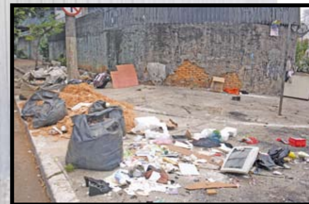
Um dos 240 pontos viciados de descarte de lixo...

A operação que você vê nesta sequência de fotos aconteceu em um dos 240 pontos viciados de descarte irregular de entulho e lixo da região central. A Subprefeitura Sé limpa em um dia e, no outro, criminosos sujam novamente – sim, criminosos, porque jogar entulho na rua é crime ambiental. Desde fevereiro, operações de fiscalização diárias vêm sendo feitas, inclusive à noite e de madrugada. Isso porque entulho jogado na rua significa bocas-de-lobo sujas e tubulações que coletam as águas pluviais entupidadas. Na hora da chuva, é enchente na certa. Nossa região tem uma equipe de fiscalização com 26 homens da Subprefeitura, além de pessoal da Polícia Militar Ambiental, da Polícia Civil, da Guarda Civil Metropolitana, da Cetesb e da Limpurb. Mas toda ajuda é bem-vinda. Para denunciar alguém que está despejando lixo e entulho na rua, ligue rapidamente para a Subprefeitura (3106-1199) ou no 156. E se você tem restos de material de construção para jogar, leve até o Ecoponto. O mais próximo daqui fica debaixo do viaduto Glicério. Nele, podem ser deixados até 1 m 3 (o equivalente a uma caixa d'água de 1 mil litros ou 50 latas de 18 litros) por dia. Se o volume for superior, é preciso contratar uma caçamba cadastrada e autorizada pela Prefeitura e a Cetesb. Só elas jogam o entulho no lugar certo. Veja a lista das empresas credenciadas no site http://www.prefeitura.sp.gov.br/cidade/secretarias/servicos/limpurb/cadastro_limpurb/index.php?p=4629 .