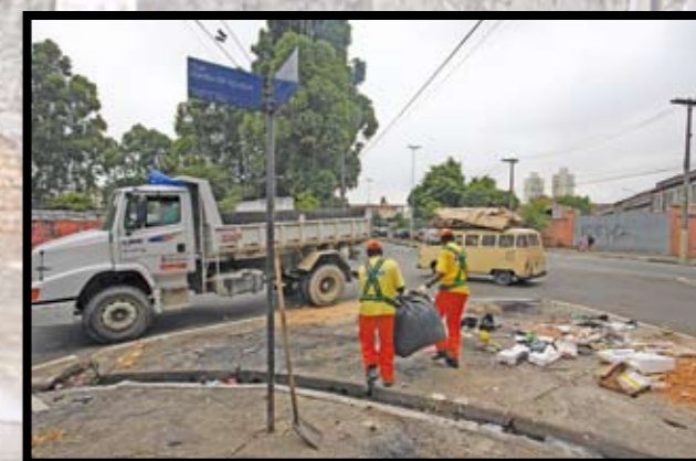
...fica entre as ruas Barão de Iguape e Junqueira Freire