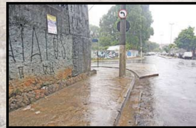
Agora, limpo. Se flagrar alguém jogando lixo, denuncie