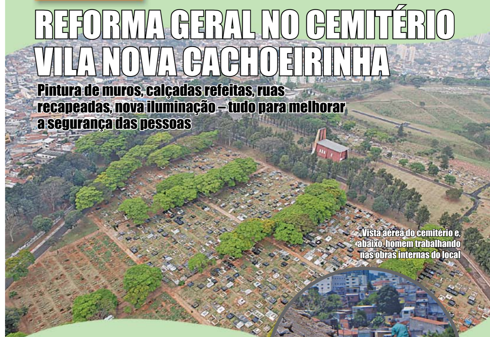
Vista aérea do cemitério e, abaixo, homem trabalhando nas obras internas do local

Pintura de muros, calçadas refeitas, ruas recapeadas, nova iluminação – tudo para melhorar a segurança das pessoas