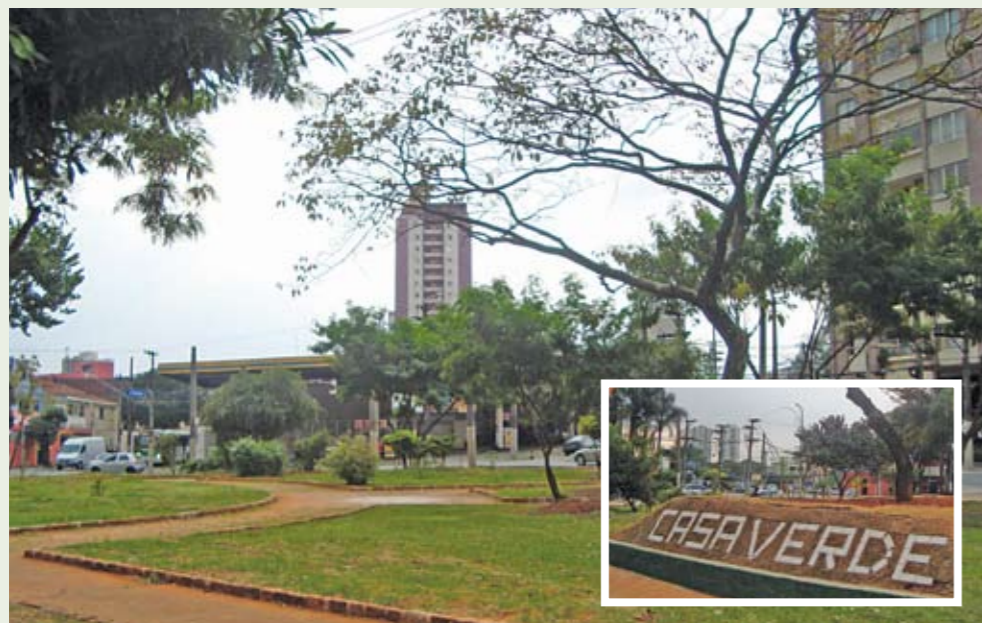
Mais verde e área de lazer bem cuidada na entrada para o bairro da Casa Verde

A chegada ao bairro da Casa Verde pela avenida Ordem e Progresso está mais bonita. A Subprefeitura reformou, em abril, a praça Delegado Amoroso Neto: cortou arbustos que dificultavam o acesso ao local e comprometiam a segurança dos pedestres, plantou palmeiras jervás para compensar as árvores retiradas da Marginal Tietê durante as obras de ampliação viária, podou outras árvores, colocou grama, recuperou as calçadas e fez um jardim com o nome do bairro inscrito em um talude.