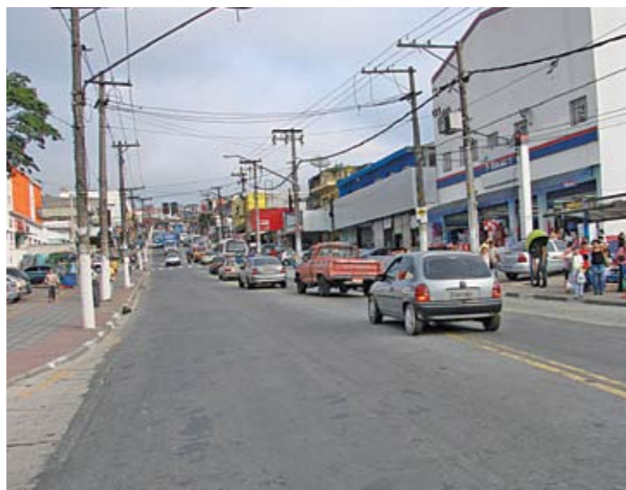
Belmira Marin, no Grajaú: ideias para melhorar a mobilidade

Prefeitura, Câmara Municipal e a população vão discutir em audiência pública melhorias para o trânsito da avenida Dona Belmira Marin. Na audiência, que será realizada no Grajaú, serão ouvidos os próprios moradores e discutidas medidas viáveis para melhorar o fluxo de veículos e, em especial, dos ônibus, a fim de facilitar a vida de todos. A data e o local do evento serão divulgados ainda em agosto pelo site da Subprefeitura.