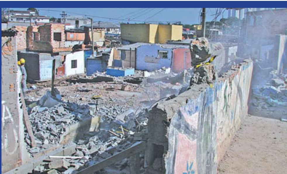
Nas comunidades 19 e 20, equipamentos urbanos e construção de 100 casas populares