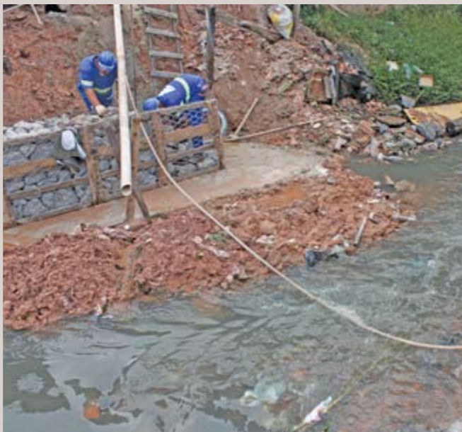
No Jardim Rosana, a nova ponte vai garantir mais segurança

M ais de 3 mil pessoas que moram no Jardim Rosana tinha muita dificuldade para ir ao posto de saúde, à feira, ao mercado ou, mesmo, para chegar ao ponto de ônibus. É que faltava uma boa ponte sobre o córrego – que agora está em construção. Antes, havia uma pequena ponte de madeira, sem segurança. A obra começou com a contenção das encostas do córrego e com o lançamento de perfis metálicos. Haverá corrimão também metálico para oferecer mais segurança aos moradores.