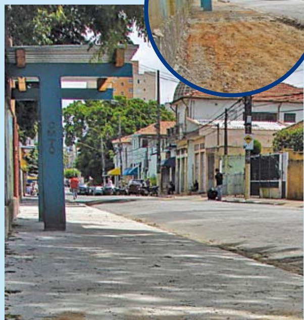
Calçada nova da escola Bartolomeu Lourenço de Gusmão

Somente este ano, foram reformadas ou construídas mais de 4.000 m 2 de calçadas em nossa região. Um dos exemplos é o do calçamento em torno da escola Bartolomeu Lourenço de Gusmão, no distrito de Vila Formosa, que foi todo refeito. E vem mais por aí. Ainda no distrito de Vila Formosa, o cronograma de serviços da Subprefeitura inclui a reforma de parte das calçadas do Cemitério de Vila Formosa; da EMEF Professor João Ortale, na praça Diogo de Aguirre; e da EMEI Francisco Roquetti, na praça Leão X. E no distrito de Jardim Aricanduva também vai ter calçada nova na EMEF Sérgio Milliet, na rua Doutor Paulo de Andrade Arantes.