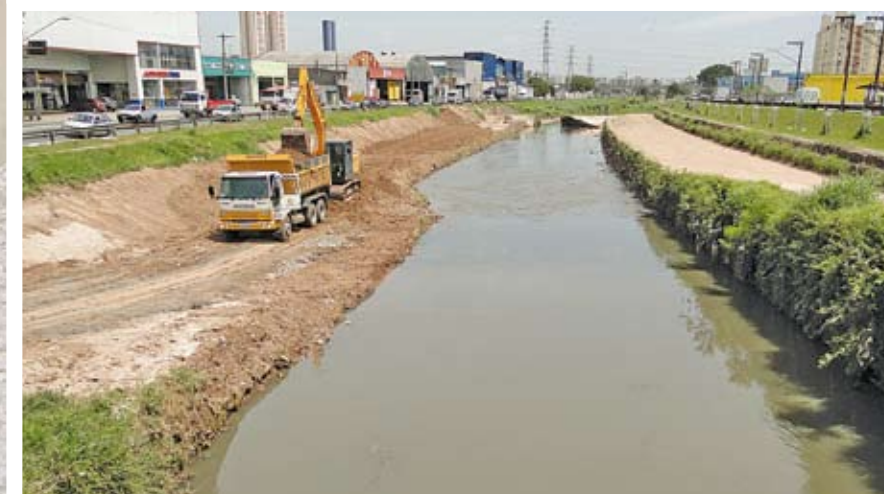
Máquinas trabalham na limpeza do leito do córrego Aricanduva