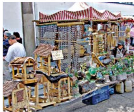
Feira de Vila Formosa: 5 mil visitantes

Os moradores das Vila Formosa e Vila Carrão têm uma boa opção de lazer e compras em duas feiras coordenadas pela Supervisão de Cultura da Subprefeitura. Instaladas em praças, as duas oferecem comidas típicas e produtos artesanais como pintura em tecido, gravações em madeira, chinelos bordados, peças em crochê, tricô, biscoito, pintura de pedras, camisetas estampadas e muito mais. Veja quando e onde elas acontecem: