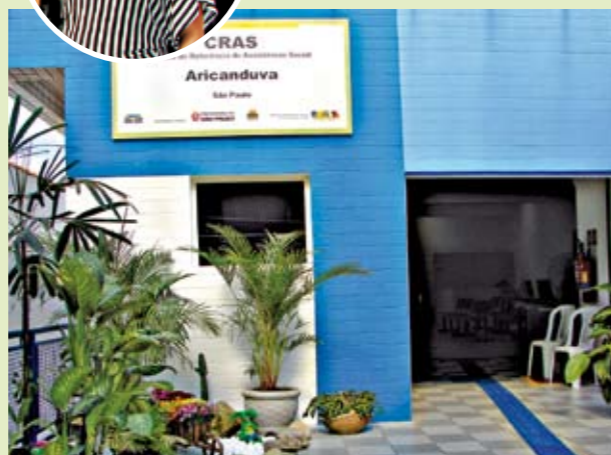
Novo prédio do CRAS Aricanduva: 6 mil atendimentos/mês