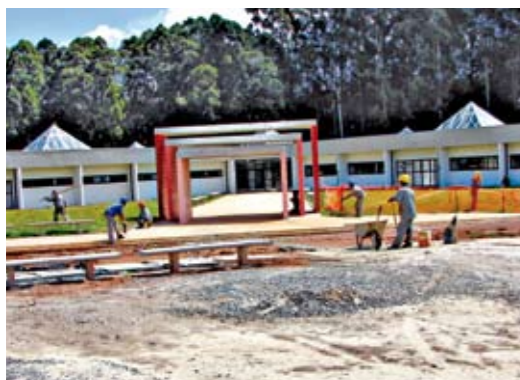
Novo velório: prédio com 2.250 m 2

Falta pouco. Já foram concluídos cerca de 90% das obras de construção do novo velório do Cemitério de Vila Formosa. Com 2.250 m 2 de área construída, o novo prédio terá 20 salas para que as famílias possam se despedir de seus entes queridos com mais conforto. Terá ainda uma sala de exposição de urnas, outra para a administração, dois espaços ecumênicos, duas lanchonetes e oito banheiros, incluindo quatro especialmente preparados para pessoas com mobilidade reduzida. O estacionamento inicialmente terá 70 vagas, que depois serão ampliadas para 140.