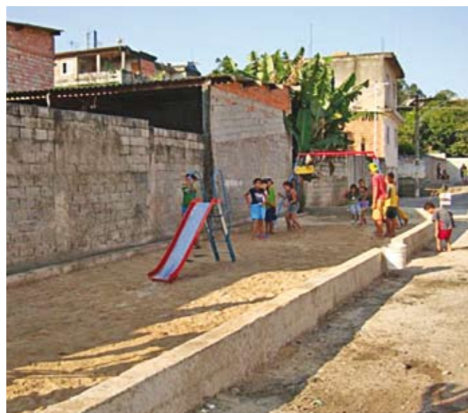
Parquinho na rua Maju: lazer para a garotada