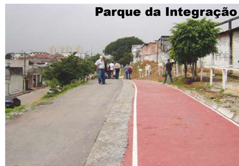
Parque da Integração