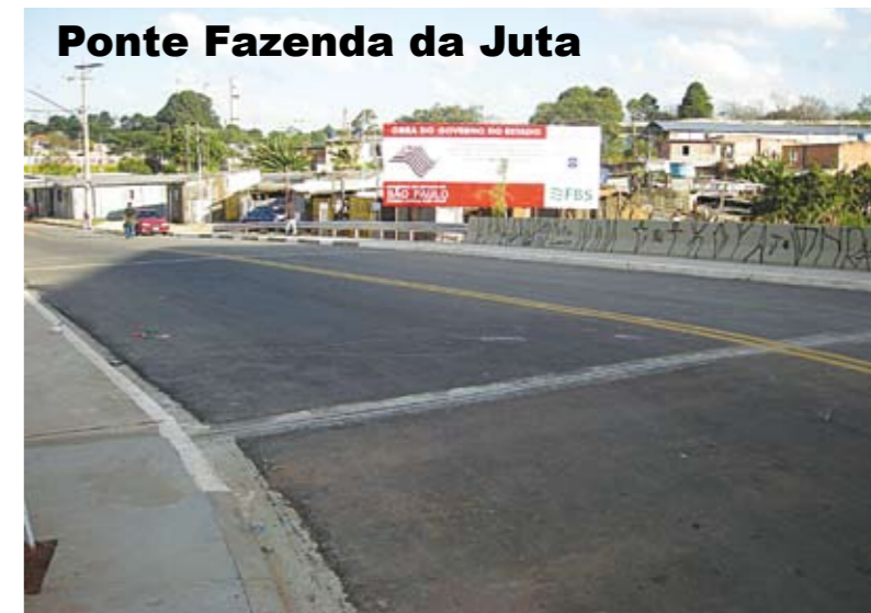
Ponte Fazenda da Juta