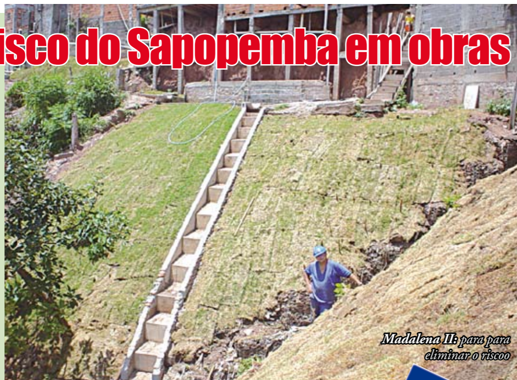
Madalena II: para para eliminar o risco

As obras na área de risco conhecida como Favela Madalena II, no Sapopemba, continuam aceleradas. Até o final do primeiro semestre estará pronta a ponte que ligará a rua Dr. Frederico Martins da Costa Carvalho à Glauber Rocha. Em seguida, a parte mais importante da obra. Para começar, a contenção da encosta, com a instalação de sistema de drenagem. O local vai ganhar, também, mais uma ponte, ligando as ruas Espinhel e Frederico Martins da Costa Carvalho. Esta etapa estará pronta ainda no segundo semestre.