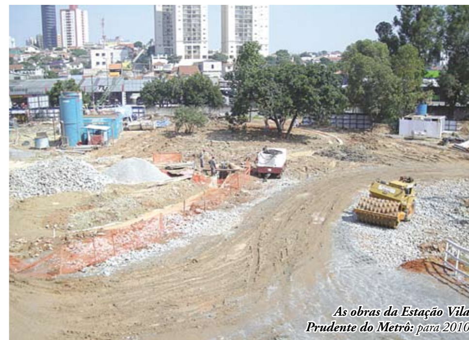
As obras da Estação Vila Prudente do Metrô: para 2010

350 mil pessoas poderão ser transportadas por dia quando o sistema estiver pronto