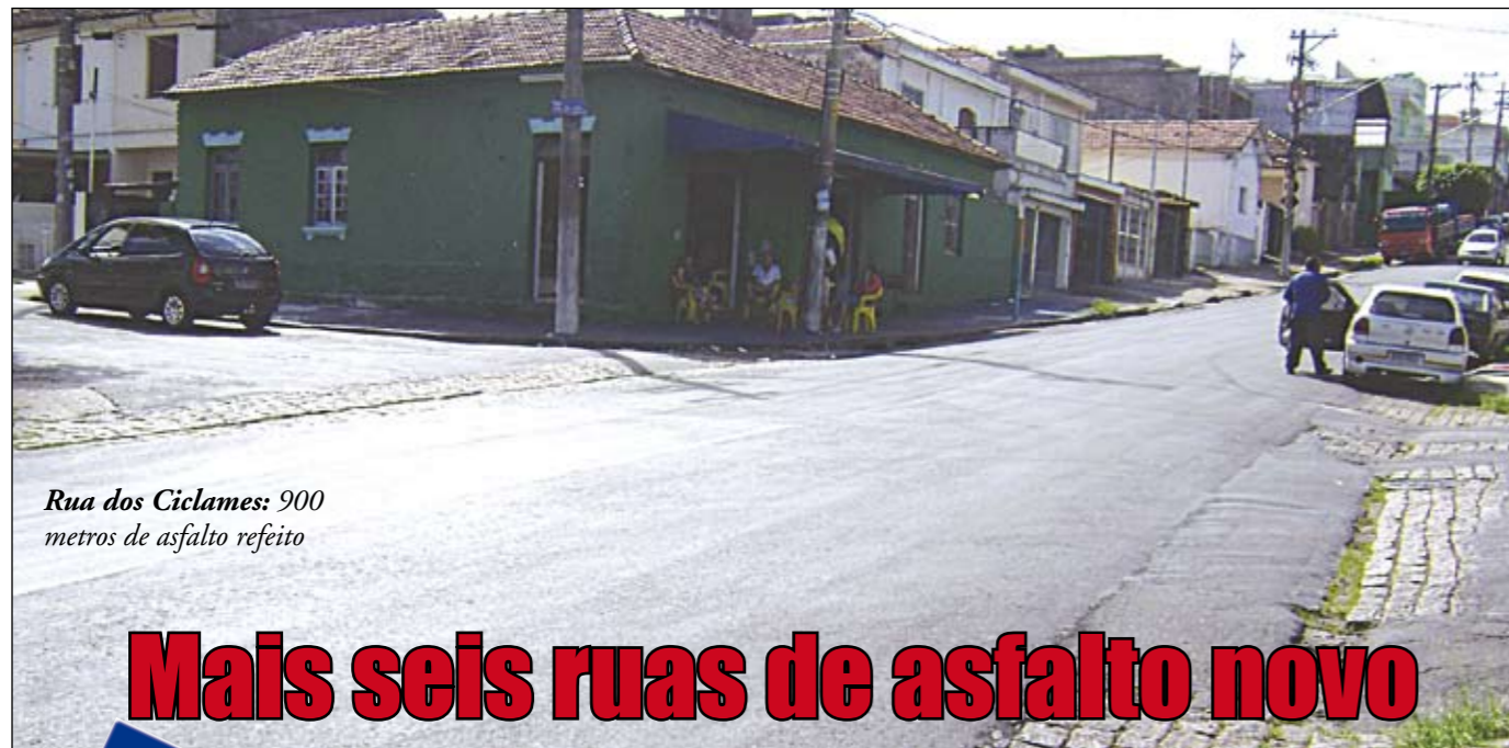
Rua dos Ciclames: 900 metros de asfalto refeito