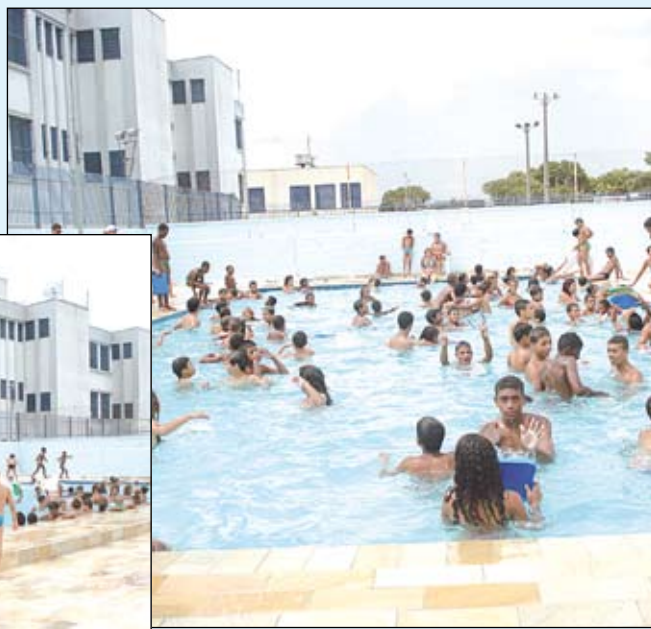
Minibalneário: agora, também Clube Escola