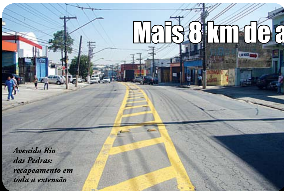
Avenida Rio das Pedras: recapeamento em toda a extensão

A nova etapa do programa de recapeamento da Prefeitura chega com força à nossa região. Serão mais 8,2 quilômetros de vias, com destaque para duas avenidas importantes: a Adélia Chohfi (que vai receber 3,3 quilômetros) e a Rio das Pedras (1,3 quilômetro), sendo que ambas serão recapeadas em toda a extensão. E o mesmo vai acontecer com as ruas Manoel V. da Costa (550 metros); Miguel Ferreira de Melo (960m); Pedro Ramazzani (815m) e Douradoquara (347m) e a Estrada dos Fidélis (970m). Desde 2005, já são 48 vias com asfalto novo em nossa região, em um total de cerca de 40 quilômetros (exatos 39,152 km). Em toda a cidade, essa fase do programa vai contemplar 240 vias, somando mais 280,5 quilômetros de recapeamento, até dezembro. No final do ano, vai ser atingida a marca histórica de 1.030,5 quilômetros de asfalto novo, ou seja, mais de duas vezes a distância entre São Paulo e Rio de Janeiro. Isso significará o equivalente a mais de três vezes o que foi feito nos 16 anos antes de 2005.