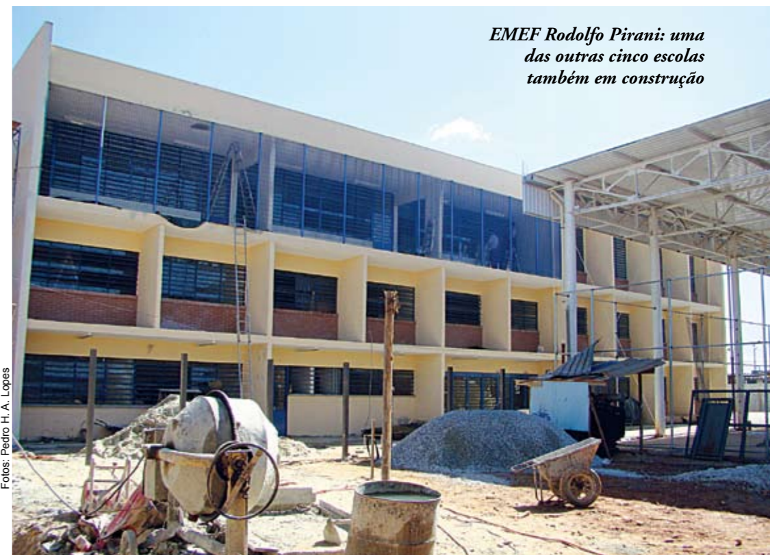
EMEF Rodolfo Pirani: uma das outras cinco escolas também em construção