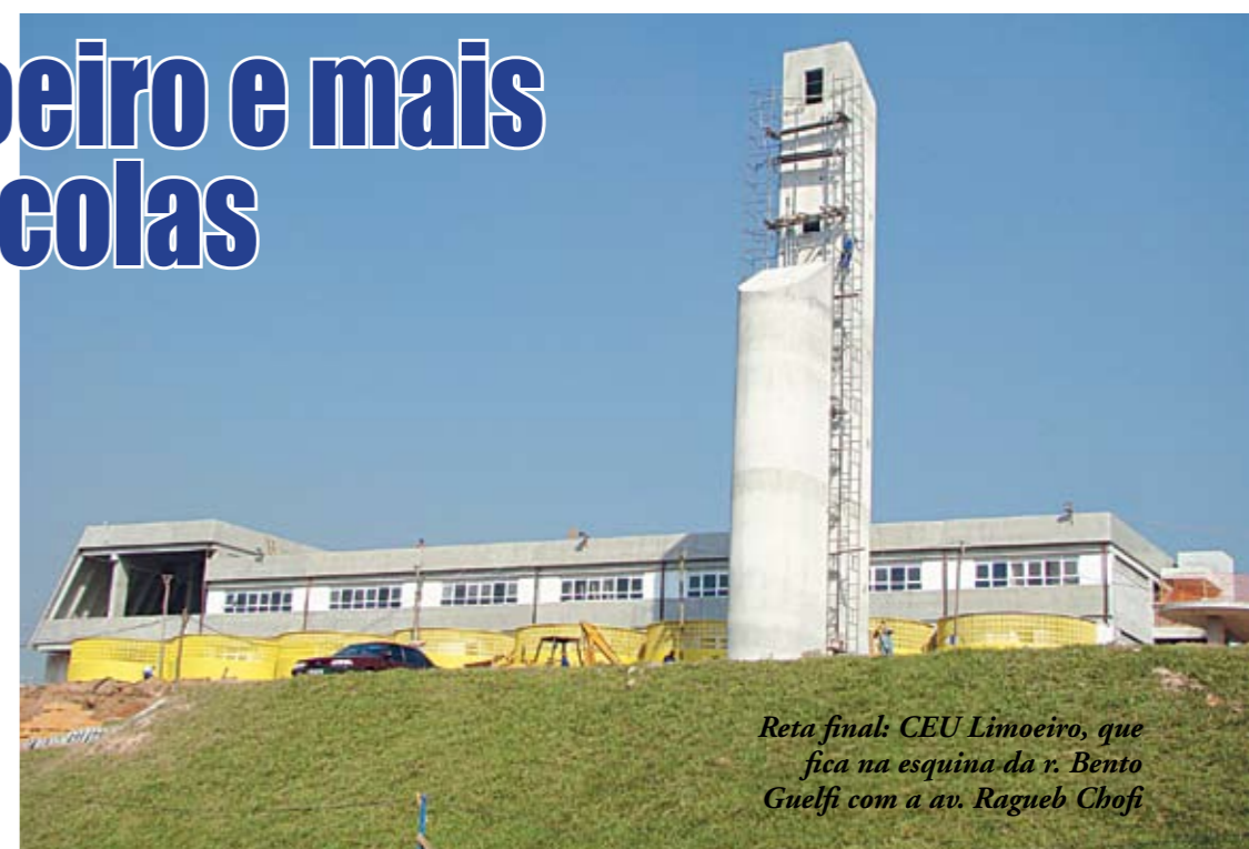
Reta final: CEU Limoeiro, que fica na esquina da r. Bento Guelfi com a av. Ragueb Chohfi

A educação municipal em São Mateus está dando dois grandes saltos ao mesmo tempo: de qualidade e de quantidade. As obras do CEU Limoeiro, por exemplo, que começaram há menos de um ano (em julho de 2007), entram em sua fase final. Serão criadas 2.450 vagas no complexo educacional, que terá dois blocos principais: o pedagógico, que abrigará três escolas (sendo uma creche, outra de ensino infantil e uma de ensino fundamental, totalizando 36 salas de aula), e o cultural, que disporá de quadra poliesportiva coberta, anfiteatro (200 pessoas), refeitório e biblioteca. Todos os blocos terão acesso para deficientes. Além do CEU Limoeiro, nada menos do que outras cinco escolas estão em construção em nossa região, totalizando oito unidades. São elas: as EMEFs Rodolfo Pirani; Cohab Iguatemi D; Joaquim Osório Duque Estrada; Francisco de Mello Palheta e a da rua Castor (ainda sem nome). De todas, a EMEF Rodolfo Pirani é a obra mais adiantada e deve ficar pronta já no próximo semestre.