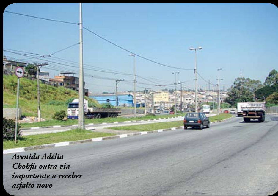
Avenida Adélia Chohfi: outra via importante a receber asfalto novo

A nova etapa do programa de recapeamento da Prefeitura chega com força à nossa região. Serão mais 8,2 quilômetros de vias, com destaque para duas avenidas importantes: a Adélia Chohfi (que vai receber 3,3 quilômetros) e a Rio das Pedras (1,3 quilômetro), sendo que ambas serão recapeadas em toda a extensão. E o mesmo vai acontecer com as ruas Manoel V. da Costa (550 metros); Miguel Ferreira de Melo (960m); Pedro Ramazzani (815m) e Douradoquara (347m) e a Estrada dos Fidélis (970m). Desde 2005, já são 48 vias com asfalto novo em nossa região, em um total de cerca de 40 quilômetros (exatos 39,152 km). Em toda a cidade, essa fase do programa vai contemplar 240 vias, somando mais 280,5 quilômetros de recapeamento, até dezembro. No final do ano, vai ser atingida a marca histórica de 1.030,5 quilômetros de asfalto novo, ou seja, mais de duas vezes a distância entre São Paulo e Rio de Janeiro. Isso significará o equivalente a mais de três vezes o que foi feito nos 16 anos antes de 2005.