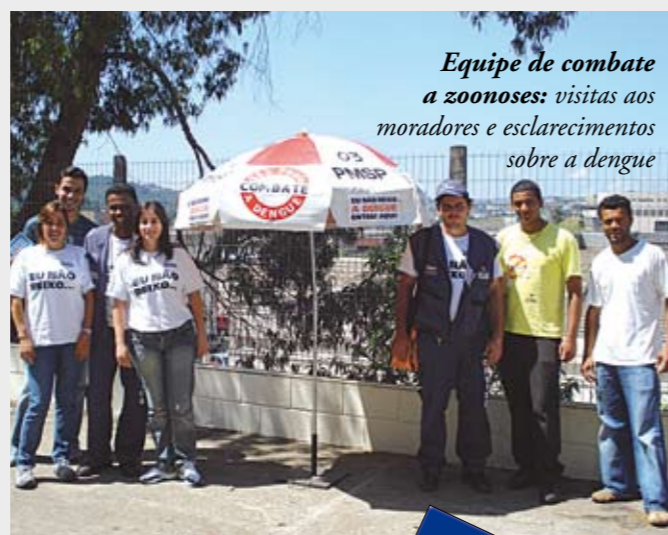
Equipe de combate a zoonoses: visitas aos moradores e esclarecimentos sobre a dengue

A Subprefeitura, por meio da Coordenadoria de Vigilância à Saúde, está engajada no combate ao mosquito da dengue em nossa região. Participou da Semana Estadual de Combate à Dengue, realizada de 31 de março a 4 de abril, da Sucen (Superintendência de Controle de Endemias). As cinco AMAs (Assistência Médica Ambulatorial) da região de São Mateus também participaram da divulgação da campanha de combate ao mosquito transmissor da doença. Os usuários dos postos puderam conferir de perto um criadouro experimental do mosquito, e acompanhar sua evolução desde a larva até a fase final, além de obterem informações importantes de como prevenir e combater o vírus da dengue. A equipe de combate a zoonoses está nas ruas, fazendo visitas domiciliares e esclarecendo os moradores quanto às medidas que devem ser tomadas para eliminar os criadouros de mosquitos. Graças a esse trabalho, os casos de dengue em nossa região caíram drasticamente. Em 2007 foram registrados mais de 40 casos que surgiram aqui na região. Em 2008, houve apenas dois casos desse tipo em São Mateus.