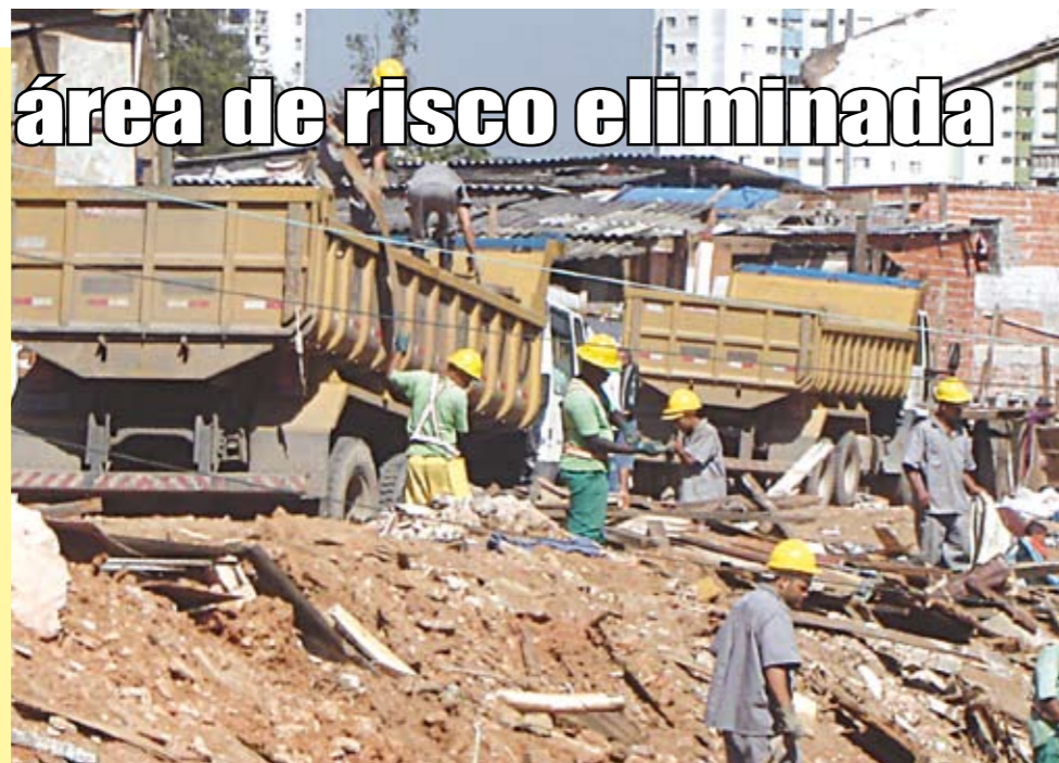
Favela Beira-Rio: risco de desabamento

Aos poucos, a Subprefeitura está conseguindo remover famílias que se instalaram em áreas de risco de Santo Amaro. Áreas de risco são aquelas que podem desabar, desmoronar, a qualquer chuva mais forte. Em março, foi eliminada uma das maiores áreas da região. Ficava no final da avenida Roberto Marinho, junto ao córrego das Águas Espriadas, e tinha mais de 430 barracos reunidos no lugar que passou a ser chamado de favela Beira-Rio. Algumas famílias receberam auxílio habitacional, outras preferiram voltar para suas cidades de origem.