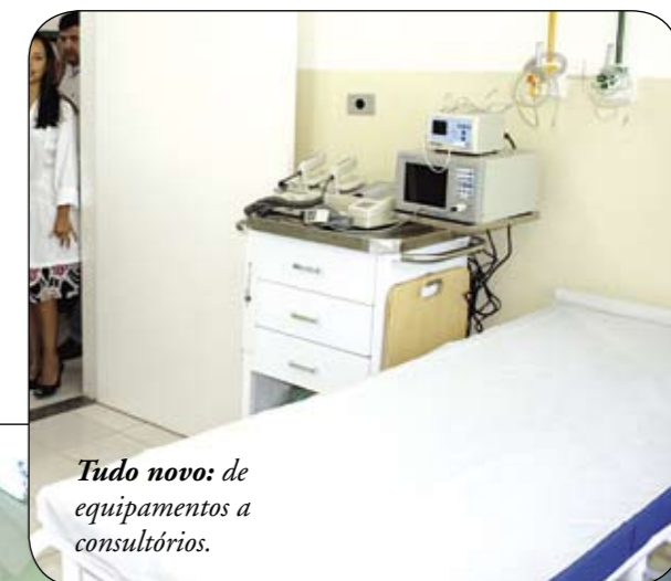
Tudo novo: de equipamentos a consultórios.

AMA Lauzane Paulista é inaugurada e pode realizar 10 mil atendimentos mensais