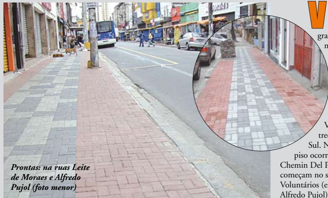
Prontas: na ruas Leite de Moraes e Alfredo Pujol (foto menor)

Várias ruas do centro comercial de Santana estão de cara nova, graças à colocação de modernas calçadas. O piso intertravado dá mais segurança e conforto para os pedestres, além de ser ecológico. O novo calçamento já foi colocado nas ruas Gabriel Piza, Leite de Moraes, Voluntários da Pátria (1º trecho) e avenida Cruzeiro do Sul. Na Alfredo Pujol, a troca de piso ocorreu entre a Voluntários e a Chemin Del Prá. Em seguida, as obras começam no segundo trecho da própria Voluntários (entre as ruas Darzan e Alfredo Pujol), totalizando 10 mil m 2 .