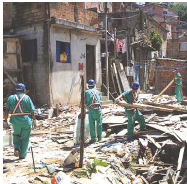
Moradias irregulares: após desocupação, limpeza.

A cabeceira do Ribeirão Vermelho, que fica na Vila Chica Luiza, próximo ao Pico do Jaraguá, vai receber intervenção da Prefeitura e da Sabesp, dentro do Programa Córrego Limpo, que vai livrar dos despejos de esgotos, nesta primeira etapa, 42 cursos d'água. As 34 famílias que ocupavam irregularmente as margens do Ribeirão Vermelho saíram do local. Com isso, foi possível remover os barracos ilegais e iniciar a limpeza do terreno. A Prefeitura construirá um canal aberto de 320 metros (em concreto armado), enquanto a Sabesp removerá as ligações clandestinas e implantará ramais de coleta de esgoto, afastando-os do córrego e preservando, assim, os lagos do Parque do Jaraguá.