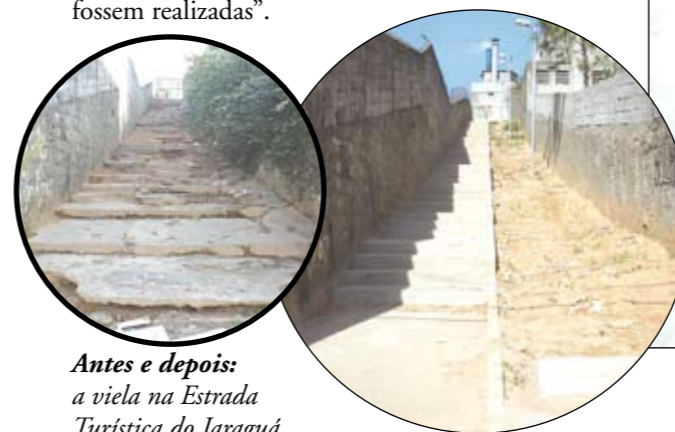
Antes e depois: a viela na Estrada Turística do Jaraguá