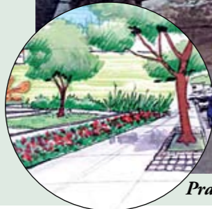
Praça Paulo Maurício (acima): confira o novo projeto no destaque (à esq.)