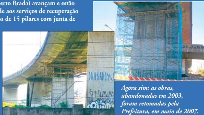
Agora sim: as obras, abandonadas em 2003, foram retomadas pela Prefeitura, em maio de 2007.

As obras no viaduto Aricanduva (Alberto Brada) avançam e estão na segunda fase, dando continuidade aos serviços de recuperação e reforço das estruturas (recuperação de 15 pilares com junta de dilatação e dos encontros; reforço das travessas e almofadas de apoio e troca das juntas de dilatação). Com 60% já executadas, as obras se concentram no trecho sobre a avenida Radial Leste e os trilhos do metrô e da RFFSA, em um total de 3.800m. Segundo o cronograma da Prefeitura (que retomou as obras em maio de 2007) se as chuvas não atrapalharem, todo o serviço deve estar concluído ainda no segundo semestre deste ano.