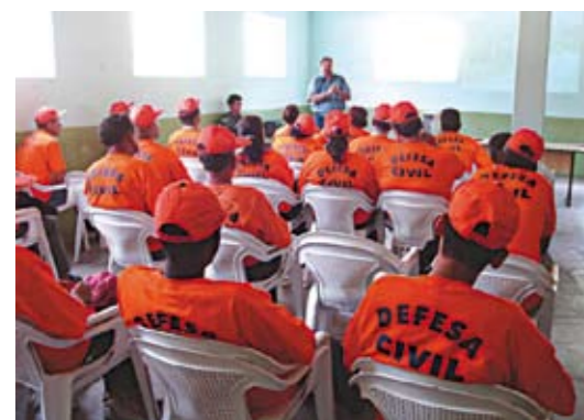
Palestra: instruções sobre áreas de risco.

21.089 atendimentos foram realizados, de janeiro a março de 2008, na Praça de Atendimento da Subprefeitura.