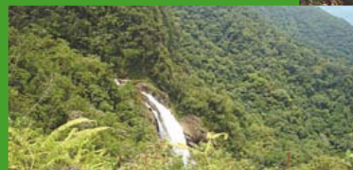
Cachoeira e usina Capivari: as belezas de Parelheiros.

P arelheiros é um dos pontos mais bonitos de São Paulo, por conta da natureza ainda não poluída. E os empresários da região tomam conta disso. Microempresários de pousadas, clubes e locadores de sítios estiveram em um encontro na Subprefeitura, no mês passado. Objetivo: organizar o setor de turismo no eixo de desenvolvimento da região, de acordo com as normas da Comissão de Revitalização do Centro de Parelheiros. Cerca de 30 pessoas participaram da reunião. Uma comissão vai definir pautas sobre o turismo.