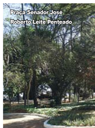
Praça Senador José Roberto Leite Penteadado

acessos, banheiros e área para piquenique. O Parque dos Remédios tem quase 100 mil m 2 de área, grande parte de Mata Atlântica nativa, com centenas de espécies da flora e fauna. O espaço tem trilhas para caminhada e área de recreação para crianças. Fica na rua Carlos Alberto Vanzolini, 413 e abre diariamente, das 7h às 18h.