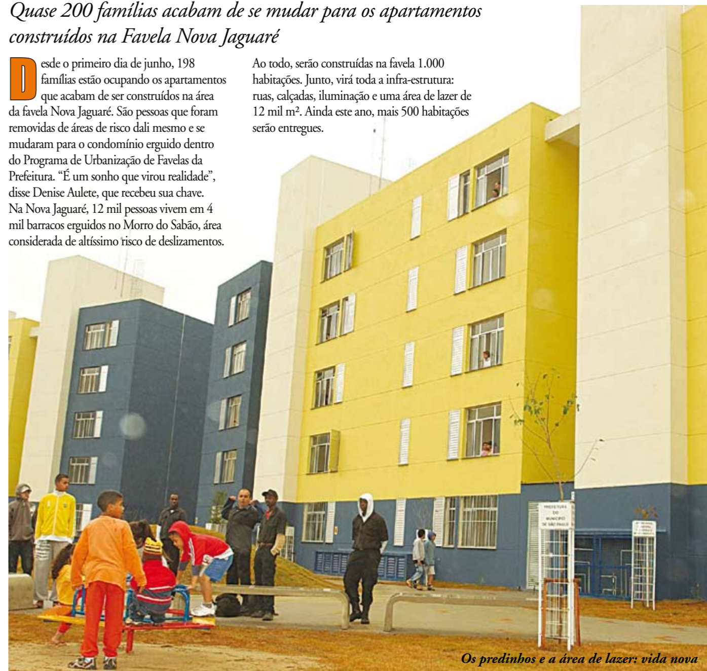
Os predinhos e a área de lazer: vida nova

Ao todo, serão construídas na favela 1.000 habitações. Junto, virá toda a infra-estrutura: ruas, calçadas, iluminação e uma área de lazer de 12 mil m 2 . Ainda este ano, mais 500 habitações serão entregues.