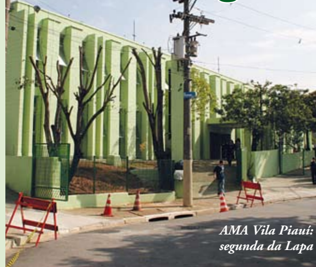
AMA Vila Piauí: segunda da Lapa