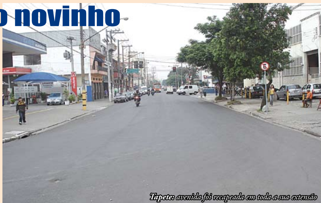
Tapete: avenida foi recapeada em toda a sua extensão

O asfalto da avenida Imperatriz Leopoldina está novinho. Terminou o recapeamento da via e agora falta apenas refazer a sinalização e pintar as faixas. Os trabalhos foram realizados à noite para evitar problemas com o trânsito. A avenida é mais uma via do bairro a ser inteiramente recapeada em toda a sua extensão. Desde 2005, já foram feitos 54 quilômetros de asfalto novo em toda a região. 38.810 buracos foram tapados.