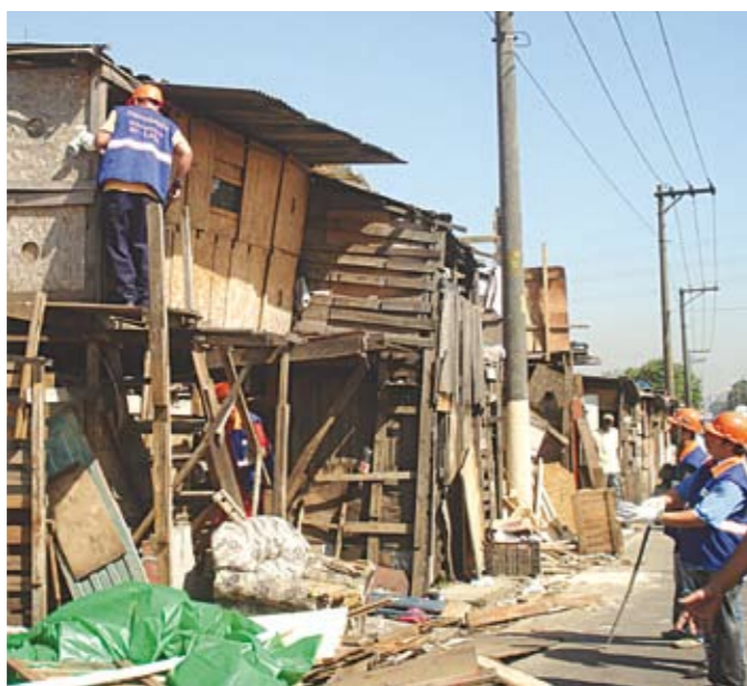
A remoção: espaço público devolvido

O lugar oferecia risco para todos: moradores, pedestres e até motoristas. Por isso a Subprefeitura removeu 21 barracos da Favela 'CPTM', que estavam instalados da pista local da avenida Nações Unidas (sentido Castelo Branco), na altura do Viaduto Jaguaré. A operação durou dois dias e mobilizou 50 pessoas e dez caminhões. Também foram retirados caixotes e restos de alimentos deixados por comerciantes da CEAGESP, que ocupavam o lado oposto.