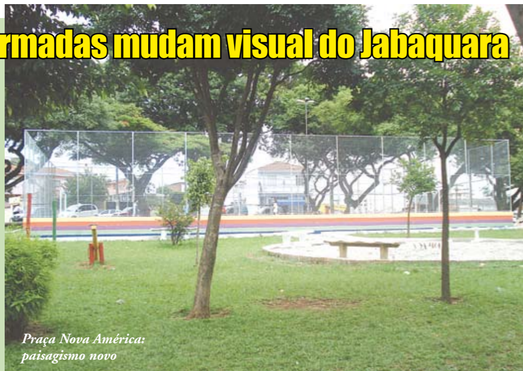
Praça Nova América: paisagismo novo

nas próximas semanas, os moradores vão aproveitar as praças reformadas da região. Recentemente, foram entregues as praças do Encontro e Rosa do Amor. E estão em fase final de obras as praças Barão de Japurá, Nova América, Withaker Penteado, Espinhaço e do Coreto (na rua Antonio Covelo). Todas elas estão com passeios novos, muretas e paisagismo, que inclui plantio de grama e mudas. Na Barão de Japurá, foi construída uma pista de skate.