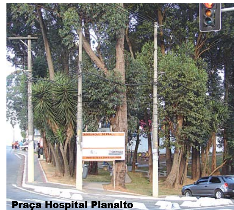
Praça Hospital Planalto