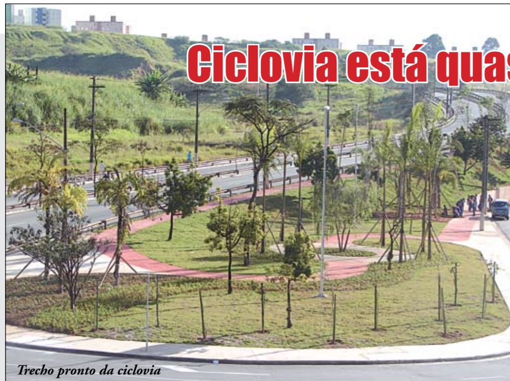
Trecho pronto da ciclovía