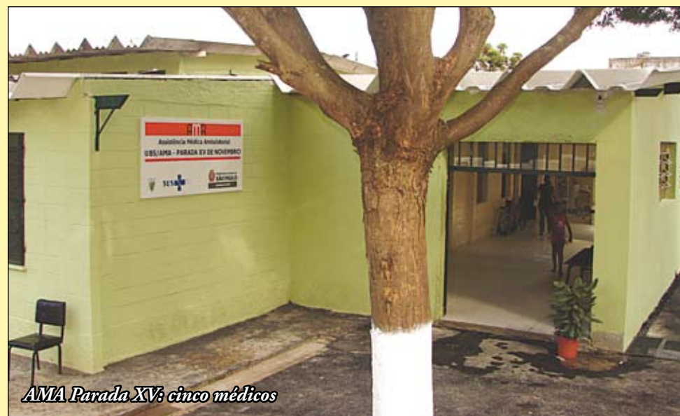
AMA Parada XV: cinco médicos

T em mais uma AMA funcionando em Itaquera: é a Assistência Médica e Ambulatorial Parada XV de Novembro, na rua Ibiajara, 804. A Universidade Federal de São Paulo (Unifesp) é parceira da Prefeitura na AMA. Vai administrar a unidade, onde há cinco consultórios médicos, salas de observação para adultos e crianças, além de salas de emergência, sutura e procedimentos ambulatoriais. A equipe médica é formada por três clínicos-gerais, dois pediatras, cinco enfermeiras, dez auxiliares de enfermagem, assistente social e três técnicos em farmácia.