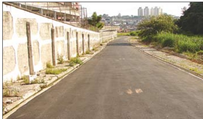
Rua Quinta de Boamense: 500 metros pavimentados

Trechos de mais duas vias de Itaquera foram pavimentados em fevereiro: ruas Aturiá (200 metros) e Quinta de Boamense (500 metros). Com essas duas, já chega a 41 o número de ruas asfaltadas pela primeira vez desde 2005. Outras duas ruas já começaram a receber asfalto: Estrada de Santa Tereza e Cristóvão Lopes.