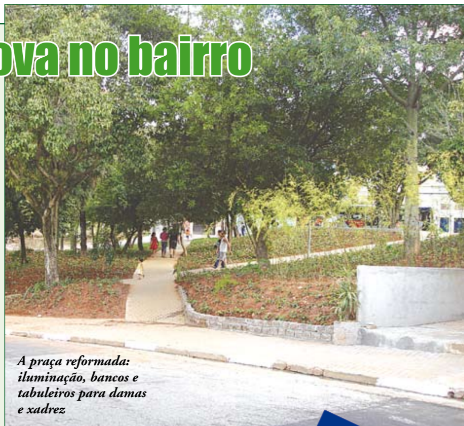
A praça reformada: iluminação, bancos e tabuleiros para damas e xadrez