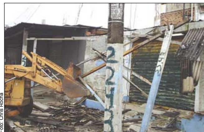
Barracos desmontados: espaço público retomado