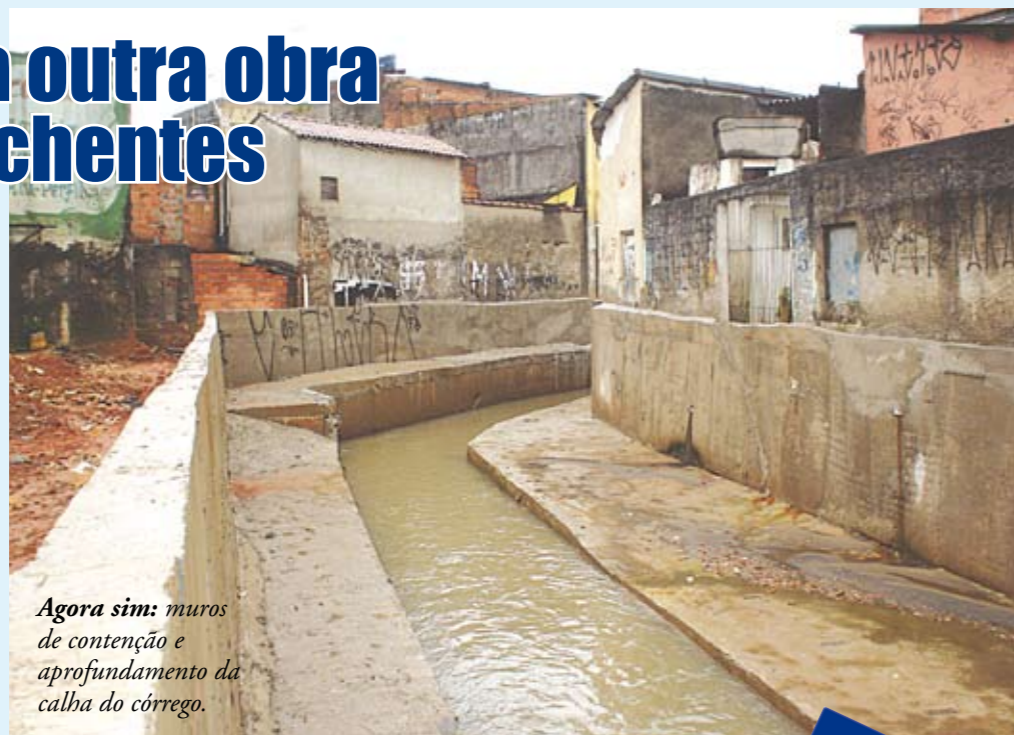
Agora sim: muros de contenção e aprofundamento da calha do córrego.