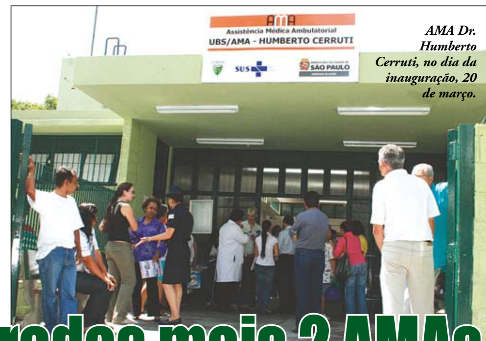
AMA Dr. Humberto Cerruti, no dia da inauguração, 20 de março.