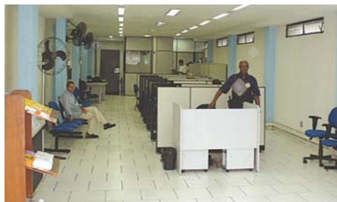
Praça de Atendimento da Subprefeitura: recadastre-se aqui

Quem perdeu o desconto do IPTU por falta de recadastramento tem uma nova oportunidade: a Prefeitura abriu prazo de até 90 dias, após o vencimento da primeira prestação, para fazer o recadastramento e pedir o benefício. Imóveis residenciais de valor venal superior a R$ 61.240,11 e igual ou inferior a R$122.480,22 têm um desconto de R$ 24.496,04 no valor que serve de base para o cálculo do imposto. Faça o recadastramento na Subprefeitura. Mais informações: 6148-6585 – ramal 219.