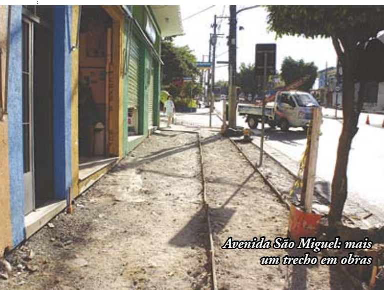
Avenida São Miguel: mais um trecho em obras

A nova etapa do programa Passeio Livre em nossa região chega ao centro comercial de Ponte Rasa. Ganharão novas calçadas, de piso intertravado, mais trechos da avenida São Miguel, entre as avenidas Boturussu e Olavo de Souza Aranha, em um total de 2.730 m 2 . Nas etapas anteriores, já receberam calçadas novas a av. Paranaguá, praça Frei Albino Aresi, largo 1º de Maio e praça Nova República, entre outros, em um total de 22 mil m 2 .