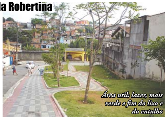
Área útil: lazer, mais verde e fim do lixo e do entulho

O lixo e o entulho deram lugar a uma praça, na esquina das ruas Ângelo Cori e Antonio Augusto de Lima, na Vila Robertina. A Subprefeitura limpou o terreno, plantou grama e 17 árvores e implantou calçadas com piso intertravado, mais seguro para os pedestres e que permite a infiltração da água no solo. O esforço valeu a pena. Desde 2005, já foram reformadas 43 praças em nossa região (112.600m 2 ).