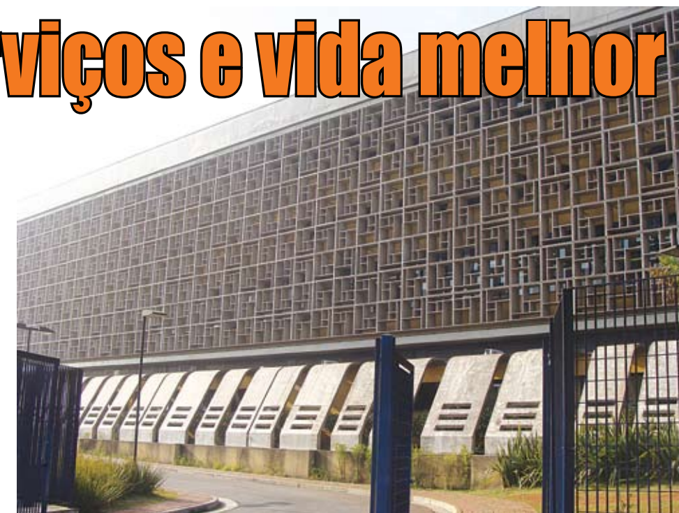
Hospital Municipal (acima) e o novo CEU Água Azul (abaixo): mais serviços.

3 telecentros implantados, 1 em implantação, mais 3 programados