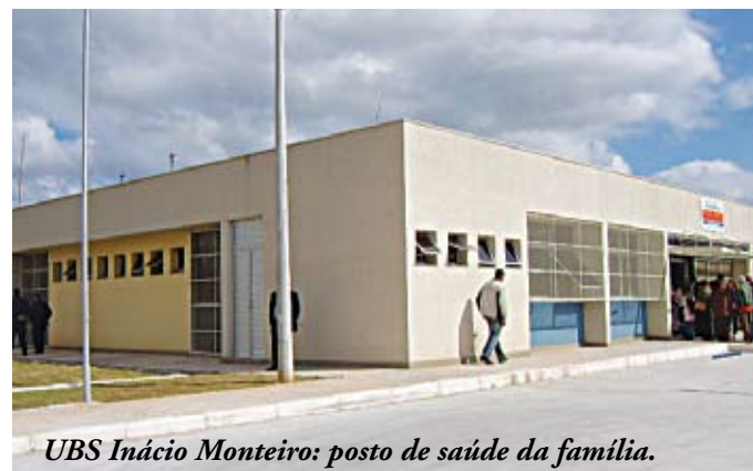
UBS Inácio Monteiro: posto de saúde da família.

Primeiro hospital municipal inaugurado depois de 17 anos, o Cidade Tiradentes é o quinto maior do município. Oferece 230 leitos, com capacidade para atender 25.000 pessoas por mês. Para melhorar a saúde dos moradores, dos 12 postos daqui, sete foram reformados e construídos mais dois: a UBS Fazenda do Carmo e a UBS/PSF Inácio Monteiro. No primeiro, já foi implantada e inaugurada uma AMA (Assistência Médica Ambulatorial).