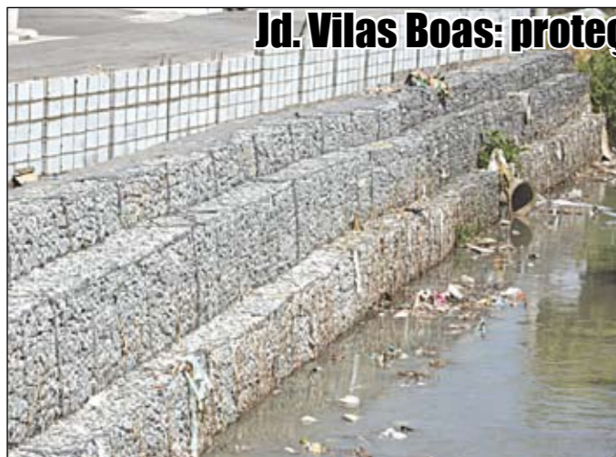
Rua Antônio Bispo de Souza: contenção com gabiões.

Parte do leito da rua Antônio Bispo de Souza, no Jardim Vilas Boas, foi levado pelas águas do córrego do Cordeiro em uma das últimas chuvas. A rua virou um local perigoso. Entre dezembro e janeiro, a Subprefeitura colocou gabiões (cestos de pedras) no local e conteve a margem que havia sido solapada. Foi reconstruído, também, o muro de proteção, a calçada e a própria rua. Agora, a rua já pode ser usada outra vez.