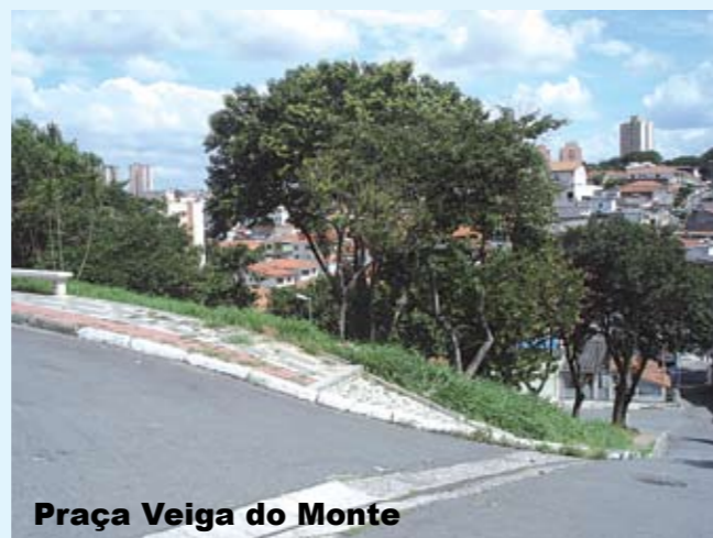
Praça Veiga do Monte