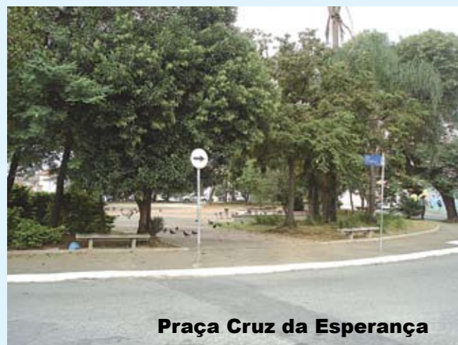
Praça Cruz da Esperança

e Carolina Roque, nas avenidas Afonso Lopes Vieira e Massao Watanabe, terão os pisos trocados, receberão manutenção e/ou instalação de parquinho, novo paisagismo e colocação de bancos e mesas.