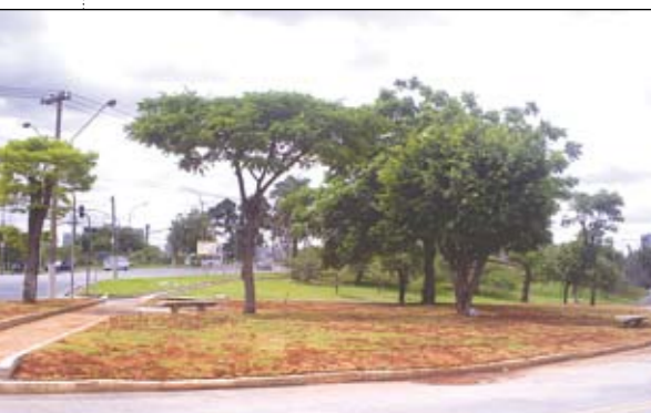
Tudo novo: na praça ao lado da alça da ponte do Limão (à esq.) e na Massao Watanabe