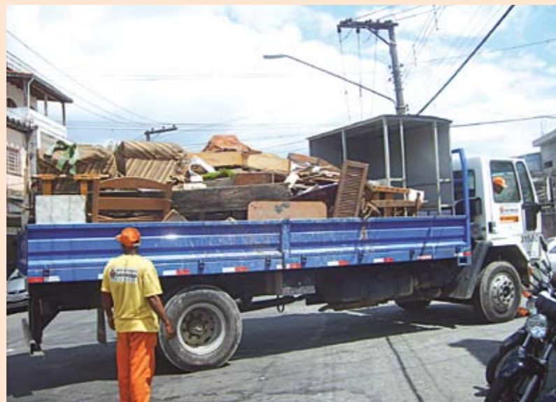
Cata-Bagulho em ação: risco menor de enchentes

Quase 37 toneladas de materiais sem uso foram recolhidas, desde o começo deste ano, nas três Operações Cata-Bagulho realizadas pela Subprefeitura. Foram objetos como sofás, pneus e móveis velhos que as pessoas não usavam mais e queriam descartar. Com isso, peças que poderiam ser arrastadas pela chuva, entupindo bueiros e provocado enchentes, foram retiradas e descartadas em lugar adequado. Foi importante a participação das pessoas, que deixaram os objetos no lugar e hora certos para os caminhões recolherem. Se você perdeu o Cata-Bagulho, faça a sua parte: entregue o material que não tem mais uso nos ecopontos da região, Cohab Adventista no Capão Redondo (Travessa Rosifloras, 301) e Parque Fernanda (rua Dr. Salvador Rocco, 400). E fique atento às próximas Operações Cata-Bagulho. Ligue na Subprefeitura e saiba quando os caminhões passarão na sua rua: 5819-9964.