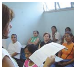
Grupo reunido: reeducação

UBS/PSF Parque Regina, rua Melo Coutinho, 260.