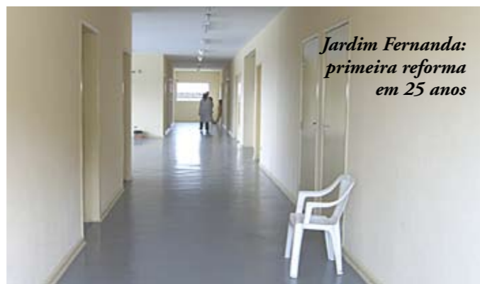
Jardim Fernanda: primeira reforma em 25 anos

Estão quase prontas as obras de ampliação da UBS Parque Fernanda, na rua Ernesto Soares Filho, 301. O posto de saúde nunca tinha sido reformado desde sua abertura, em novembro de 1982. Além de reforma geral no prédio que já existia, foi construída uma área anexa de 520 m 2 com dez consultórios, brinquedoteca e consultório odontológico.