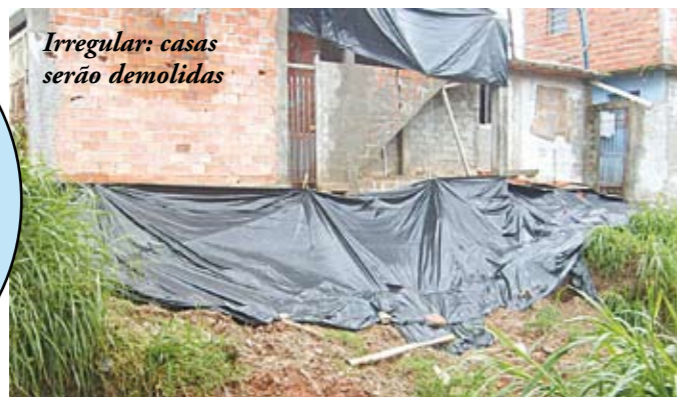
Irregular: casas serão demolidas

Ruas de Lazer funcionam na região. Transforme também a sua. Ligue 156