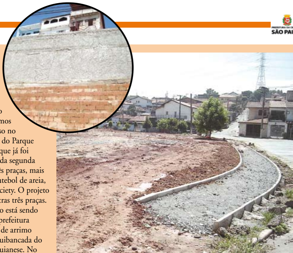
O muro de arrimo (acima) e o parque linear: obras no Rio Pequeno

A Subprefeitura vem dando atenção especial ao Rio Pequeno nos últimos meses. Várias obras estão em curso no distrito. Uma das mais importantes é a do Parque Linear do Sapé. A primeira fase do parque já foi concluída e agora começaram as obras da segunda etapa. Ainda este ano serão feitas ali três praças, mais uma quadra poliesportiva, campo de futebol de areia, pista de Cooper e quadra de futebol society. O projeto já tem prontas uma pista de skate e outras três praças. Outra obra importante no Rio Pequeno está sendo tocada na Favela São Remo. Ali, a Subprefeitura eliminou uma área de risco. Um muro de arrimo foi construído na parte superior da arquibancada do campo de futebol localizado na rua Aquianese. No mesmo local foi, também, instalada uma praça.