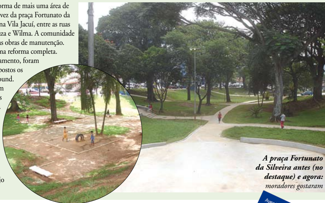
A praça Fortunato da Silveira antes (no destaque) e agora: moradores gostaram

Ficou pronta a reforma de mais uma área de lazer. Agora foi a vez da praça Fortunato da Silveira, que fica na Vila Jacuí, entre as ruas Cel. Manuel F. de Souza e Wilma. A comunidade vinha pedindo algumas obras de manutenção. A Subprefeitura fez uma reforma completa. Além da troca do calçamento, foram refeitos os jardins e repostos os brinquedos do playground. Mesas para jogos foram colocadas na praça. Os moradores aprovaram. É a quarta praça reformada pela Subprefeitura. Outras quatro foram construídas, entre elas a Almíscar, em um espaço antes utilizado para o despejo irregular de entulho.