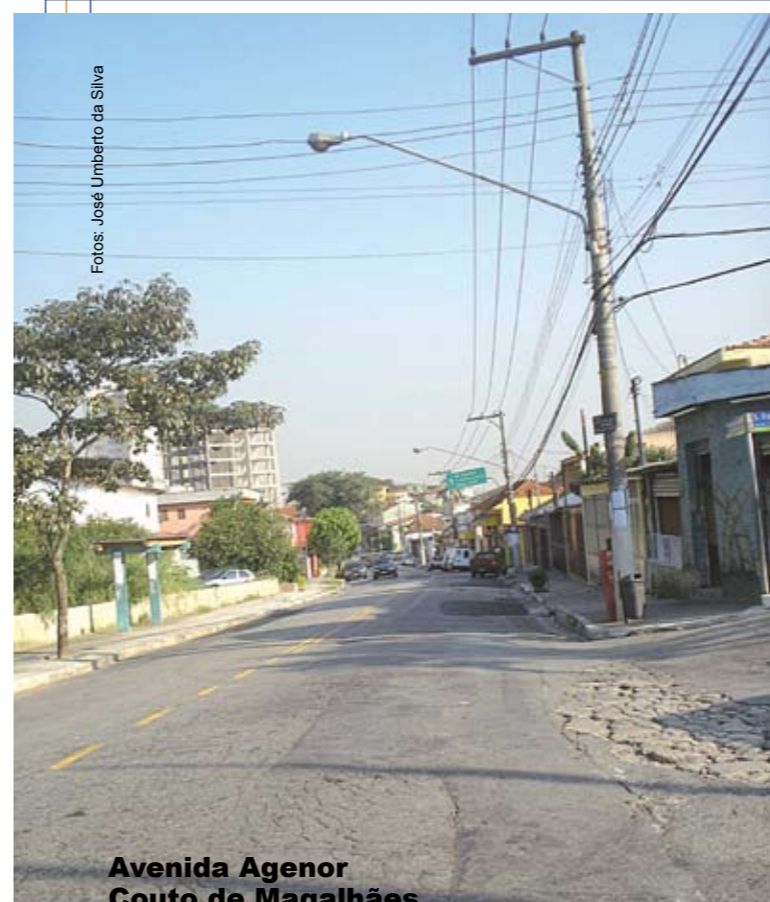
Avenida Agenor Couto de Magalhães

22 quilômetros de vias recapeadas desde 2005