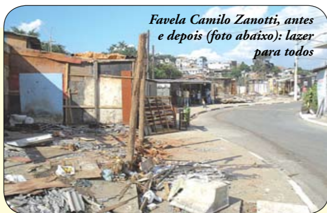
Favela Camilo Zanotti, antes e depois (foto abaixo): lazer para todos

Área de 30 mil metros quadrados, ocupada irregularmente pelas favelas Camilo Zanotti, Triângulo, Margem do Rio do Fogo e Pinheirinho D'Água, foi totalmente reurbanizada após a saída negociada das 534 famílias, que entenderam estar morando em uma área de risco. As obras de melhoria já estão finalizadas: colocação de passeio, reconstituição de talude, plantio de grama, implantação de paisagismo, instalação de bancos e mesas e um playground, para as crianças que moram no Conjunto Habitacional City Jaraguá, próximo do local. Com a recuperação da área, a Secretaria do Verde e Meio Ambiente, em conjunto com a Subprefeitura, desenvolve um projeto para que o local seja integrado ao Parque Linear Perus. Assim, essa grande área foi devolvida à comunidade, resgatando um importante espaço para todos.