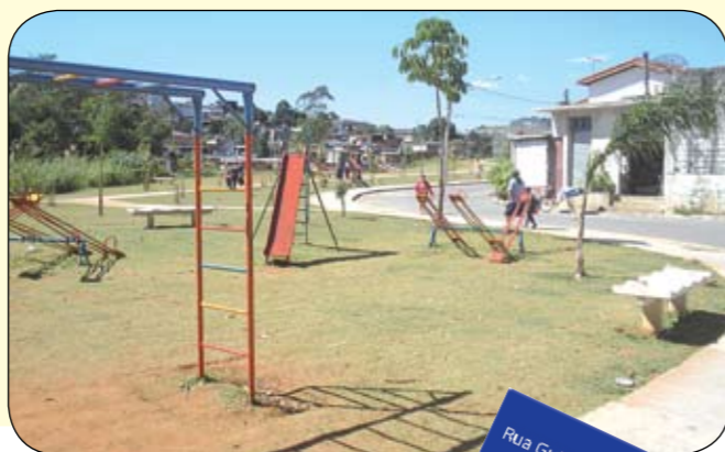
Rua Guiomar Novaes