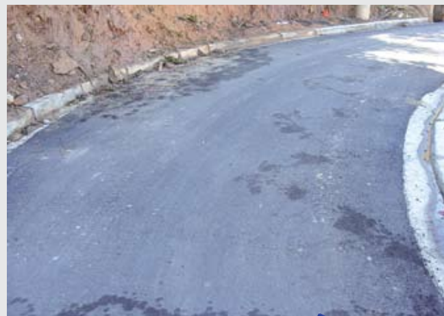
Agora sim: as ruas Rio Iguape (foto à esquerda) e Caminho Omar Bradley (foto à direita), já pavimentadas