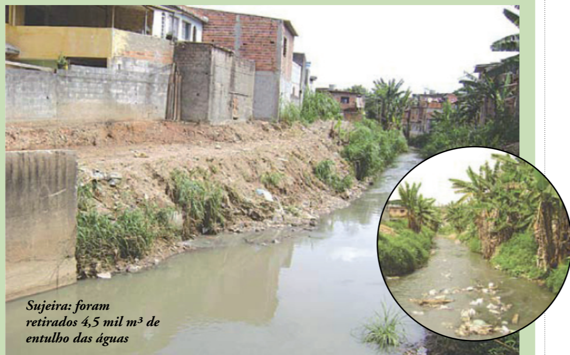
Sujeira: foram retirados 4,5 mil m 3 de entulho das águas

O córrego Piqueri, na Vila Zilda, está passando por serviços de limpeza e desassoreamento, como parte do plano para combater as enchentes da região. Com o uso de uma máquina retroescavadeira, já foram retirados cerca de 4.500 m 3 de material pesado das águas, tais como entulhos, pneus e lixo. O desassoreamento foi realizado numa extensão de 1.500 metros lineares do córrego, utilizando uma máquina especializada para a retirada da vegetação e alargamento das margens, que foram desobstruídas.