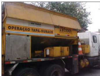
Unidade tapa-buraco: mais simples e mais econômica.

A ré recentemente, os trabalhos tapa-buraco eram considerados serviço de engenharia, o que determinava uma concorrência. Graças a um novo entendimento jurídico, instituiu-se o pregão (presencial, não eletrônico) e todo o processo ficou mais ágil e econômico. No último pregão, os licitantes apresentaram suas propostas e rezereram os lances em novas rodadas até chegar ao mínimo. Conseguiu-se uma redução de 10% no custo. E ainda houve ganho de qualidade: o serviço contratado utiliza